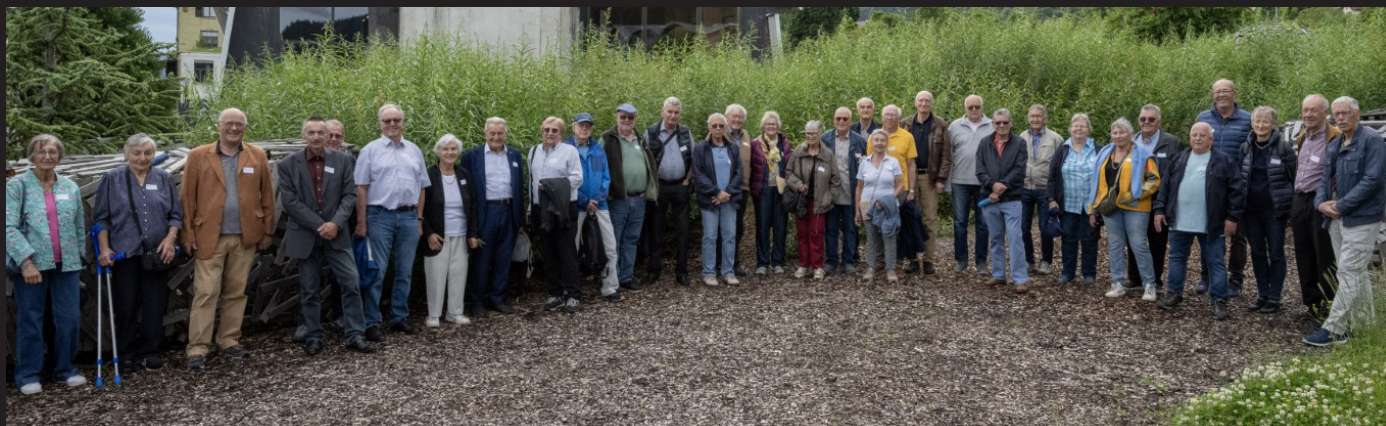
Invités à la fête, une partie des jubilaires qui présentent 50 ans de sociétariat.

Avec plus de 40'000 membres au compteur, la section neuchâteloise du TCS franchit un cap symbolique et prometteur. Un dynamisme salué lors de l'Assemblée générale à Cernier, où de nouveaux projets ont été dévoilés.