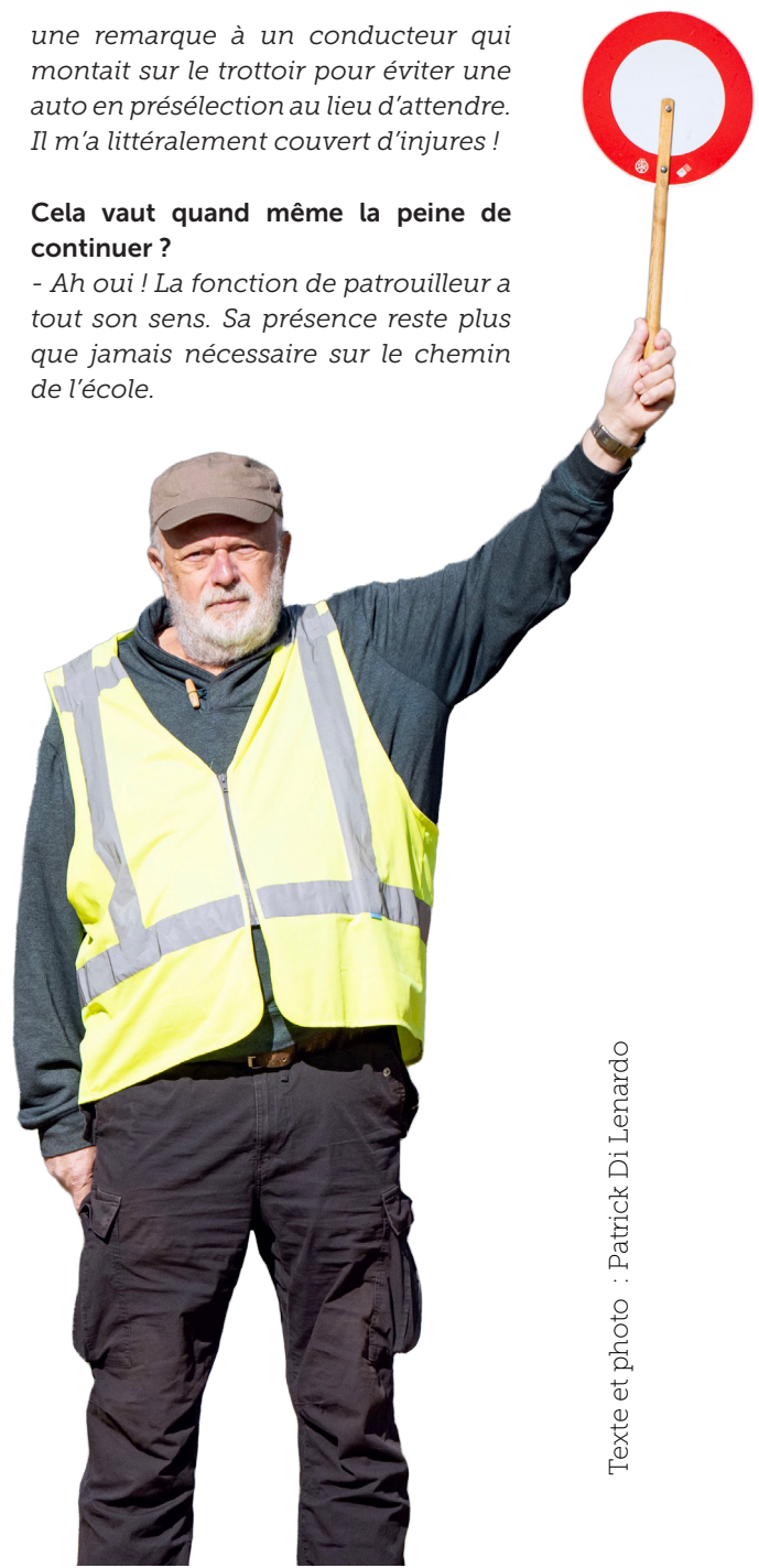
Texte et photo : Patrick Di Lenardo

- Ah oui ! La fonction de patrouilleur a tout son sens. Sa présence reste plus que jamais nécessaire sur le chemin de l'école.