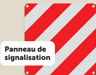
Panneau de signalisation

Une large gamme d'accessoires obligatoires pour équiper votre véhicule est disponible au Centre TCS de Fontaines.