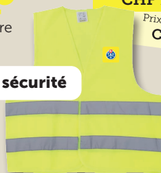
Gilet de sécurité