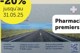
Pharmacie de premiers secours