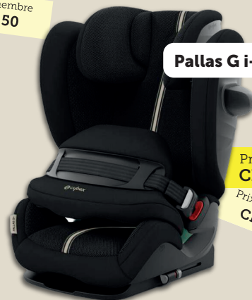
Pallas G i-Size Plus

Âge : De 15 mois à 12 ans ou 76 cm à 150 cm